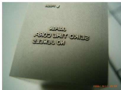
精密彫刻(彫刻機で作った電極を用いて放電加工、素材は超硬)