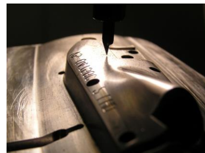
彫刻機を用いて自由曲面上に文字彫刻を施す