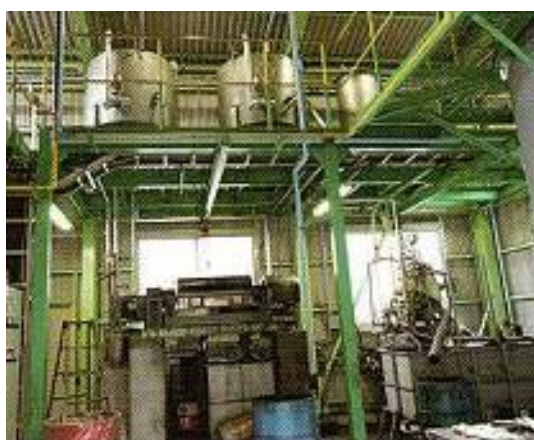
廃油の油水分離処理施設