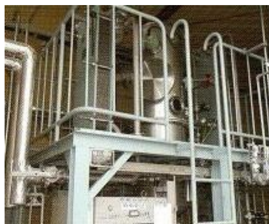
廃 LLC 濃縮処理施設