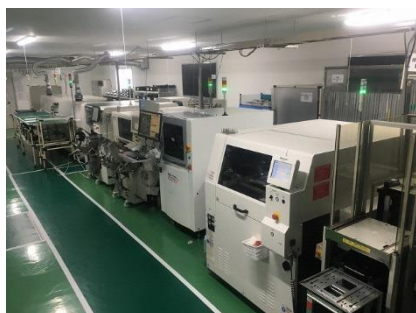
SMT 実装ライン及び 3次元検査装置群