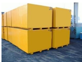
トラック運搬用水槽

軽量で腐食しない性質を利用した製品開発を得意として店舗用活魚水槽、温泉湯貯蔵タンク、防熱タンク、円形タンク、アワビやウニなどを飼育する養殖用水槽、FRP 物置などいろいろな分野の製品を製作しています。