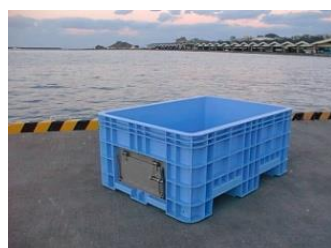
ステンレス開閉扉付