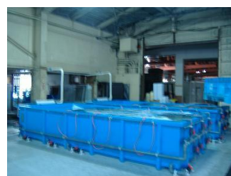
濾過槽一体型活魚