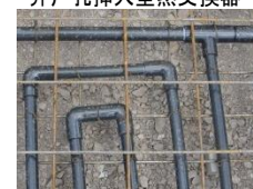
特性アースヒートパイプ 20A