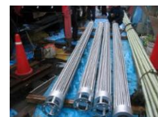
井戸孔挿入型熱交換器