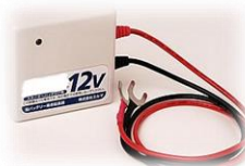
バッテリー延命装置