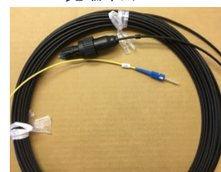
センサーマット製造