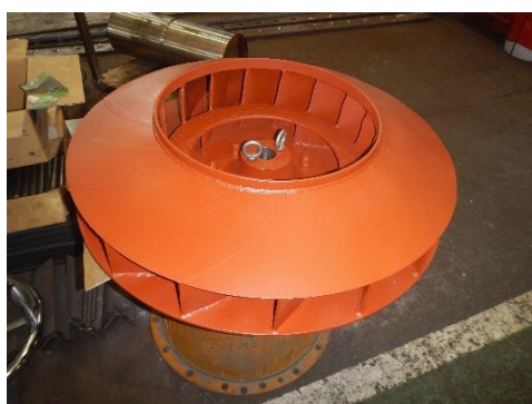
製作、硬化肉盛されたランナー