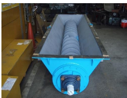
製作、硬化肉盛された コンクリート投入機