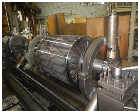
製作した真空ポンプローター

生産設備の補修作業で、ほぼ全ての工程を社内で完結できる為、短納期での補修が可能です。また、設備の不具合が起きた原因を追究し、より耐久性の高い設備への改良も行います。