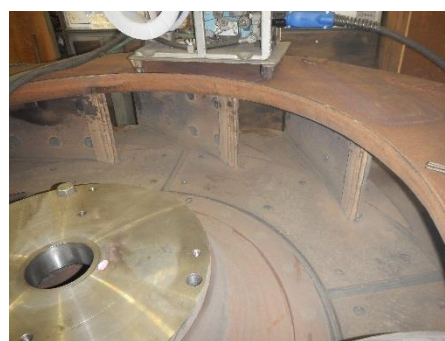
硬化肉盛プレートを貼り付けた 製鉄用排気ファンランナー