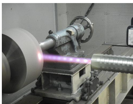
高速フレイム溶射による タングステンカーバイト溶射

生産設備の補修作業で、ほぼ全ての工程を社内で完結できる為、短納期での補修が可能です。また、設備の不具合が起きた原因を追究し、より耐久性の高い設備への改良も行います。