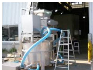
塩水氷製造装置(開発品)