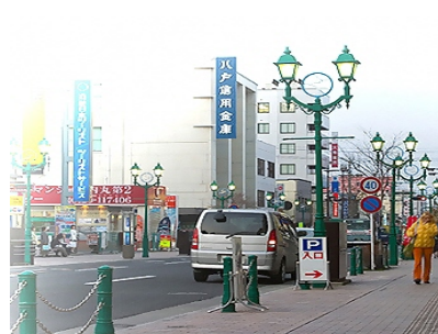
八戸市八日町の街路照明灯

鑄物は、振動を押さえる効果が大きく、また複雑な形状等どんな形のものでも作る事ができるため、光学機器や半導体機器など精密機器の土台や建機用マニホールドなどに使用されており、当社の製品は大手メーカーから発注を受け、全国に納入実績があります。