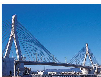
青森ベイブリッジ