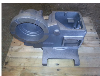
自動ロボット用部品