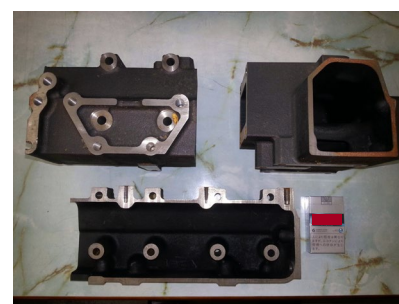
小型建機用マニホールド