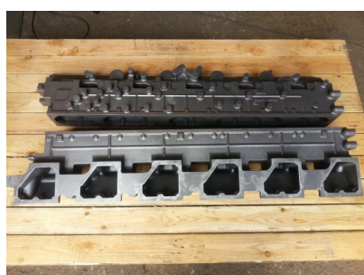
大型建機用マニホールド