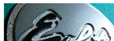
メタル・ネームプレート