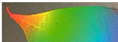
しおり・ホログラム