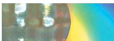
メタル・ホログラム