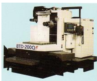
横中ぐりフライス盤