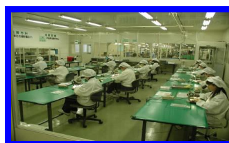
微細部品加工ライン