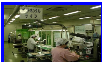
センサ組立ライン