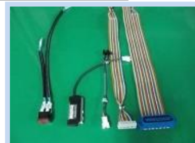
コネクタケーブル