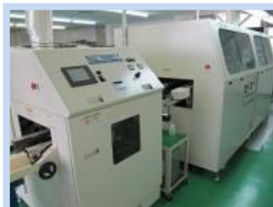
基盤 DIP 組立