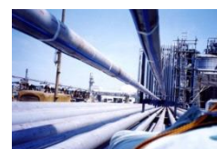
化学プラントの保温加温