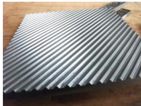
切削加工技術の一部