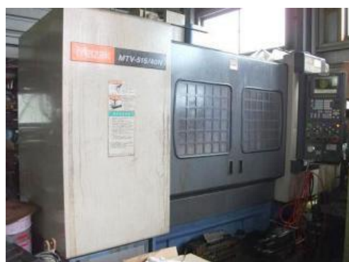
マシニングセンタ