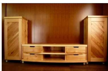
テレビボード(団らん)