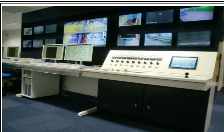
中央監視制御盤(産業廃棄物処理プラント用)