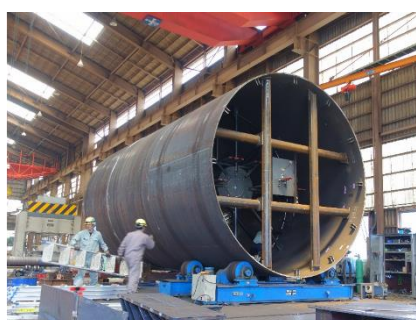
ロータリーキルン胴体 Φ4.7m x L8.9m x t30~t45