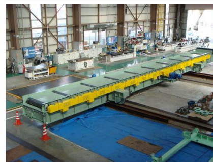
トラバーサ W3.5m x L19.6m(積載重量17t)