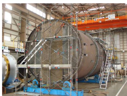
熱交換器 Φ4.1m x L7.5m (重量51t)