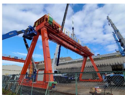
門型クレーン (10t/3t+10t) x 18m