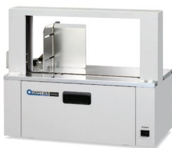
帯掛機 (テープット WX)