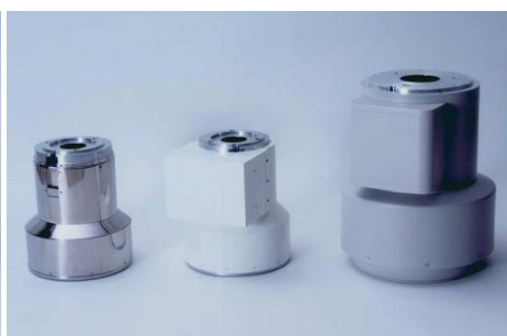
X線蛍光増倍管容器