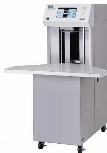
紙枚数計数機 (カウントロン N2500)