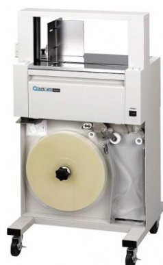
帯掛機 (WII スタンドアロン)