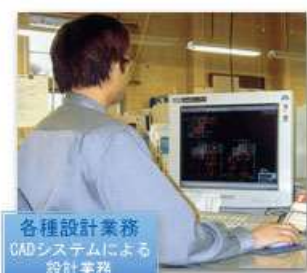
各種設計業務 CADシステムによる 設計業務