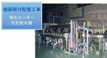
機器据付配管工事 浄化センター 汚泥脱水機