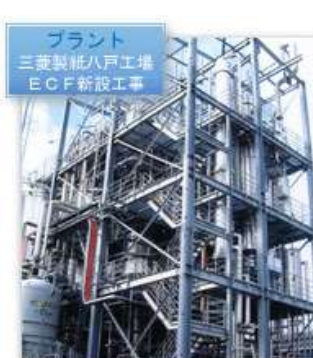
プラント 三菱製紙八戸工場 ECF新設工事