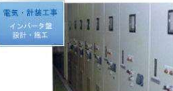
電気・計装工事 インバータ盤 設計・施工