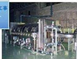
浄化センター 汚泥脱水機