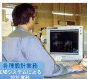
各種設計業務 CADシステムによる 設計業務