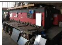
シャーリングマシン