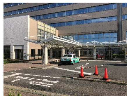
労災病院車寄せ鉄骨