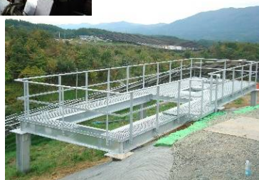
太陽光パネル架台