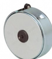
シンクロナスモータ