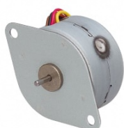
ステッピングモータ