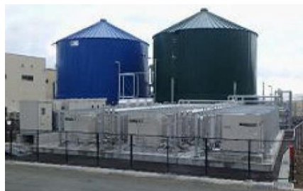
有機物未利用エネルギー活用 バイオマス消化ガス発電設備