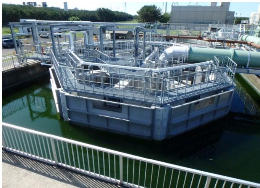
下水処理施設 高効率固液分離設備 高速ろ過装置