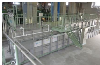
下水処理施設 汚泥削減装置 (バイオダイエット)