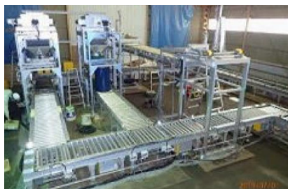
震災復旧溶融減容化施設 ドラム缶自動充填装置