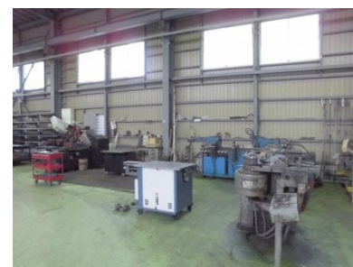
パイプ類加工機 各種サイズ、ワークに対応する金型多数保有。