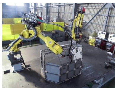
協調型溶接ロボット 2台が1つのワークの相互干渉動作を認識し、高能率で溶接稼働。