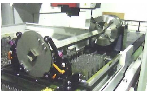
NC ターンテーブル大口径レーザー加工機 最大口径150mmの角パイプの貫通把持が可能。 パイプ受けの設置により長尺物の加工も可能。

3D レーザー加工、パイプベンダー、スポット溶接、プレス加工等、産業機械部品の製作に幅広く対応する設備を有しています。 また、自社開発の横型プレスは、現場ニーズから生まれた業界唯一の機能で、受注加工のみならず本体直販も年々普及増加しております。