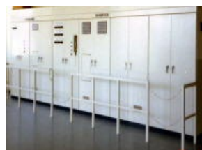
仕分搬送ラインシステム