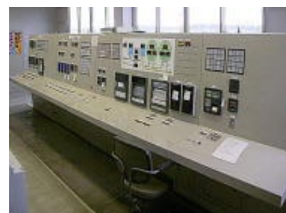
コンソールデスク盤