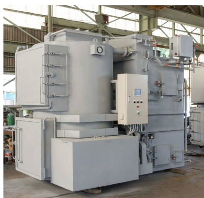
ジェットクリーンボイラー-KH シリーズ