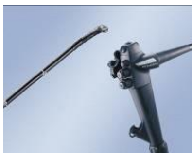
内視鏡ビデオスコープ