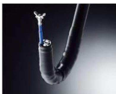
医療用処置具製品