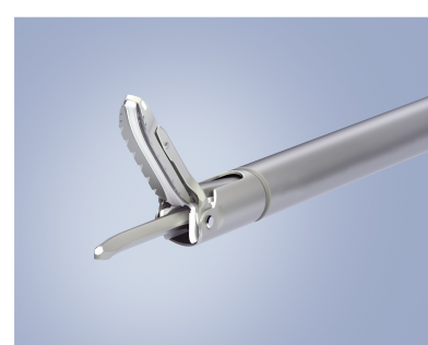
外科手術用エネルギーデバイス