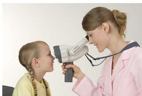
眼科眼鏡機器製品 ハンディ・オートレフラクトメータ (Righton 製品)