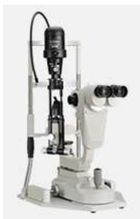
眼科眼鏡機器製品 スリットランプ MD-50D (Righton 製品)