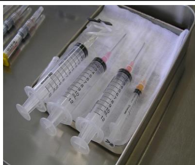
感染性産業廃棄物