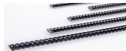
製品 ネジテツコン