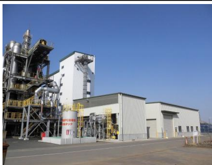
低濃度 PCB 無害化処理