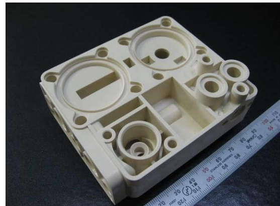
医療器具向け射出成形部品 材質: 樹脂(変性 PPO/PPE)