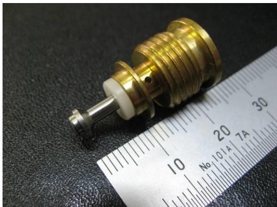
エアーツール向け切削部品 材質: 真鍮、ステンレス、樹脂(POM) 部品の圧入も行います。 (圧入力・抜去力管理含む)