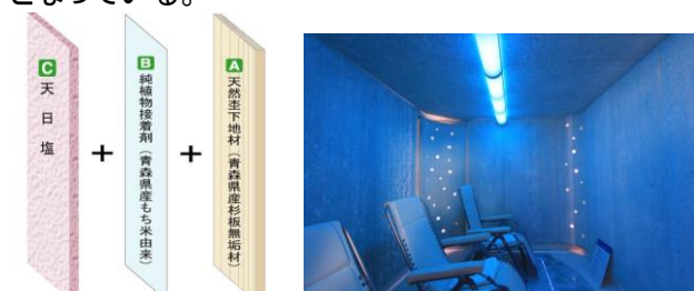
ソルトウォール工法

独自技術として『ソルトウォール工法(特許取得)』による空間づくりで、青森県産品と天然マテリアルにこだわり青森県薬剤師会衛生検査センターの分析で「空気中科学物質濃度検査 VOC」において、わが国における基準値をはるかに下回る成績となっている。