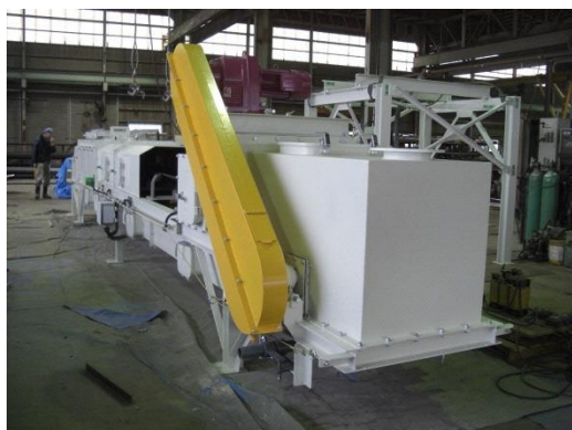
ベトナム電力会社カバー

病院、各公立学校、給食センター、保育園、製氷貯水施設、食糧機器(例: 昆布巻自動洗浄カッター)、厨房関係、各工場内のダクト、カバーフード、金属工芸品等を日本全国から相談、受注、納品をしております。