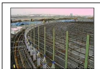
LNG タンク底板 架台及びSECT 管