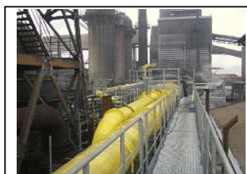
ガス燃料供給ライン設備

モノづくりの最高のパートナーであるために。 新しい価値を見出すために。 わたしたちは努力します。