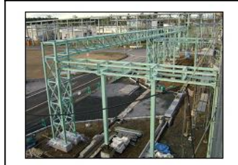
配管ラインラック設備