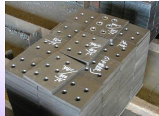
孔明ショットブラスト加工