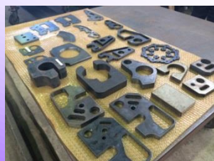
プラズマ切断製品