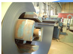
鋼板コイルカッターライン