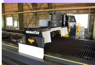
最新鋭ツイスター加工機