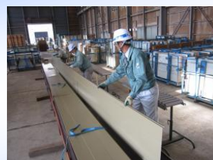
屋根用成型品加工