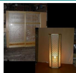
小物入れ付スタンド