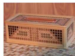
ティッシュボックス