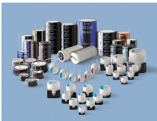
アルミ電解コンデンサ工程