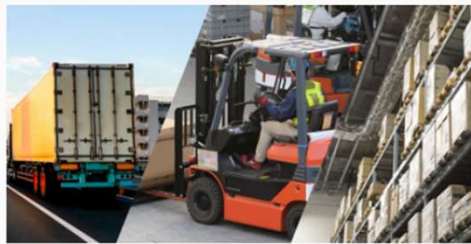
物流業向けシステム

設立以来、日常生活用品の物流業務の改善に取り組んできた信頼と実績ある製品を提供します。