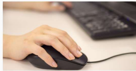
事務処理改善システム